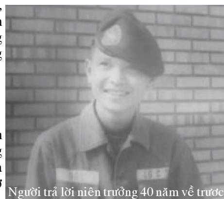
Người trả lời niên trưởng 40 năm về trước.

Tôi với niên trưởng có nhiều giao cảm, nên tập thơ “ Vô Lượng Tình Sâu ” của Niên Trưởng đến tay tôi bất ngờ, vào một chiều thứ bảy mưa bão. Nơi tôi ở là vùng đồi núi, nhìn núi đồi mờ mịt, mây mù quấn quanh những đỉnh núi, không hiểu tại sao tôi ... muốn khóc. Chưa mở tập thơ, chưa đọc một bài, chỉ mới nhìn hình bìa với hàng chữ “ Vô Lượng Tình Sâu ” tôi thấy lòng rưng rưng ... ! Tôi biết những lời thơ ở bên trong sẽ là ký ức ... đồng cảm với tôi. Cảm ơn Niên Trưởng đã gửi tặng “ Vô Lượng Tình Sâu ”.